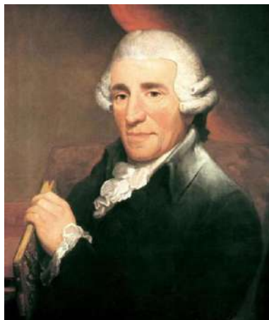
2. Йозеф Гайдн