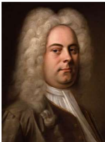
1. Георг Гендель

16. Рассмотрите портреты 3х композиторов. Напишите полное имя того из них, кто был великим современником героя видеофрагмента: _____;