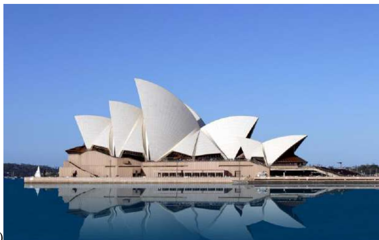
2. (илл. А)