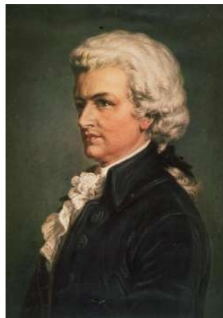
3. Вольфганг Амадей Моцарт